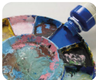
Farb- und Raumgestaltung