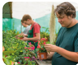
Garten- und Landschaftsbau